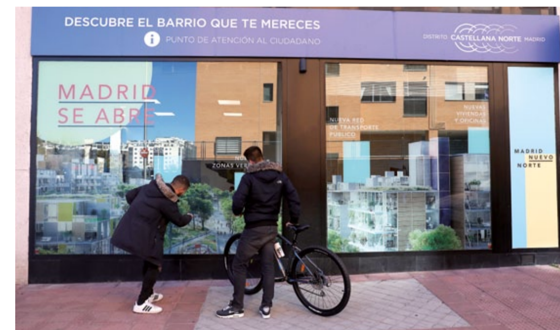
A la izquierda, unos vecinos en el exterior de una de las oficinas de atención al ciudadano de Distrito Castellana Norte. A la derecha, portada de la memoria de Compromiso Social.

En materia de "innovación social", Del Pozo ha subrayado que para estar a la "vanguardia" del urbanismo mantienen contacto directo con varias universidades madrileñas con la intención de buscar conjuntamente