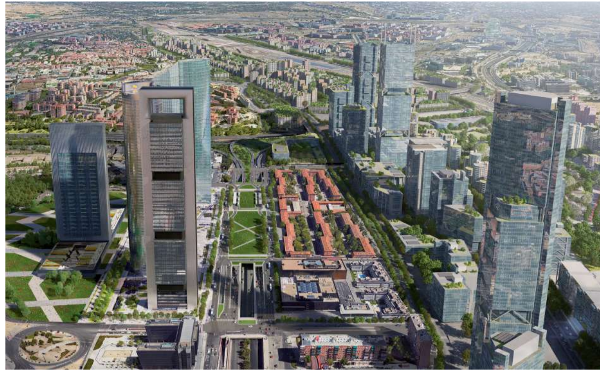
ROGERS STIRK HARBOUR + PARTNERS

Asimismo, el proyecto contempla enlazar adecuadamente con el entronque del Nudo Nor-